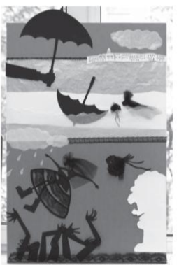
Силуэтные марионетки к фильму «Букет невесты»