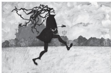
Силуэтная марионетка к фильму «Петербургский фотограф»

семечки, блестящие, песочную анимацию, трогая все это руками, художник может создать неповторимое произведение, передать его удивительную теплоту».