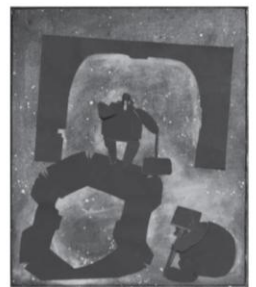
Силуэтные марионетки к фильму «Дворник»

не дай бог ударить в грязь лицом... Здесь важна эмоция и умение раскрепоститься, умение стать снова детьми. Это всем понравилось». Необычный набор материалов тоже был не случайным — всё это, как поясняет преподаватель, по-