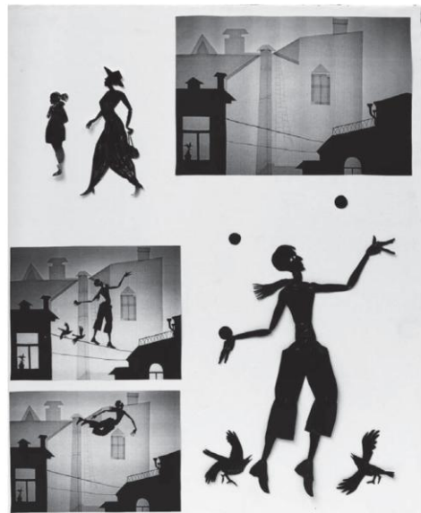
Силуэтные марионетки к фильму «Канатоходец»