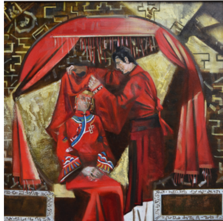
Суй Дзе «Свадьба» руководитель Филиппов А.М.