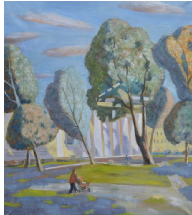
Ван Ицзя «Академический сад» Ласка Т.В.