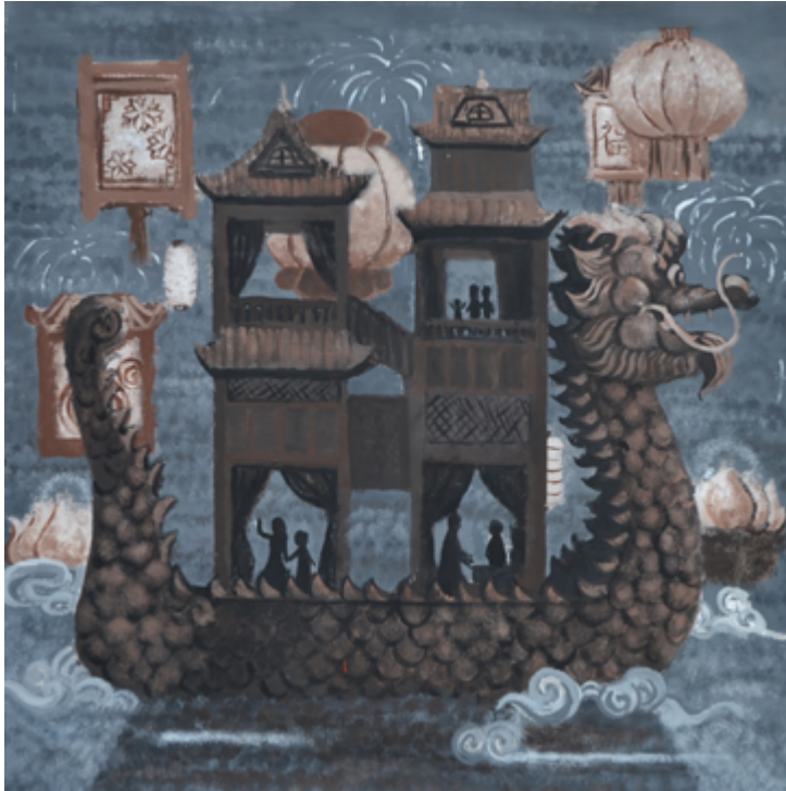
Ван Итин «Праздник драконов» руководитель Филиппов А.М.